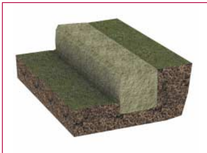
Ρίχτι από ημιλαξευτές πέτρες.