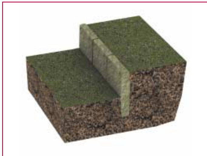
Ρίχτι από κατακόρυφες πλάκες.