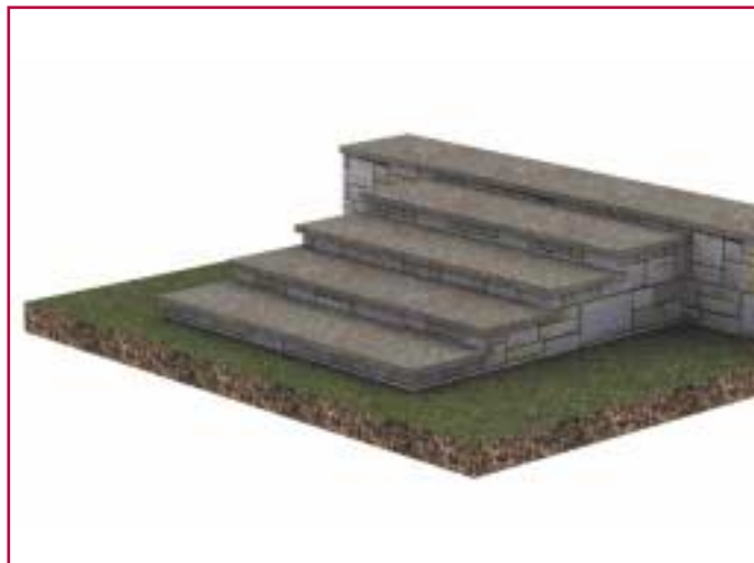
Βαθμίδες από σχιστόπλακες.