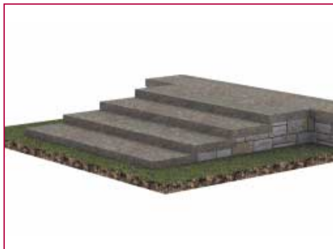
Βαθμίδες από λαξεμένους λίθους.