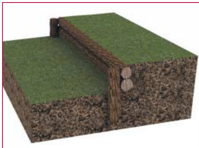
Ρίχτι από ξύλινους πασσάλους.