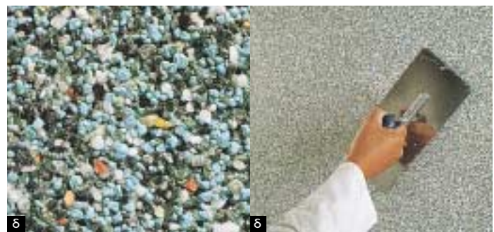
Διάφορα είδη διακοσμητικών επιχρισμάτων: α. Τριφτό με λεπτή άμμο. β. Τριφτό με λεπτή άμμο και αδρανή. γ. Σπατουλαριστό με ελάχιστο ανάγλυφο. δ. Κοκκώδες με διακοσμητικά αδρανή.